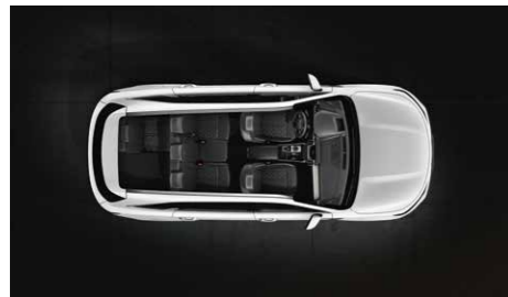
Tercera fila parcialmente plegada

No importa qué quieras hacer o qué tengas planeado transportar, el Sorento está más que preparado.