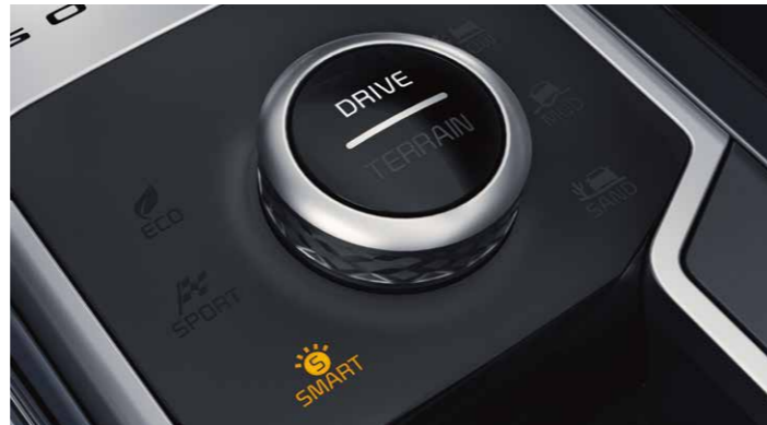
SELECTOR MODO DE CONDUCCIÓN (DMS)

Las levas de cambio permiten cambiar de marcha rápidamente sin tener que quitar las manos del volante. También potencian la dinámica de conducción, lo que permite aumentar con mayor rapidez el par motor sin esfuerzo y sin perder el control.