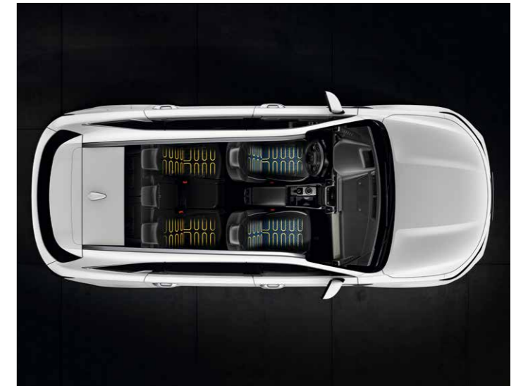
ASIENTOS DELANTEROS CALEFACTABLES Y VENTILADOS

Para un mayor confort y comodidad, tanto el asiento del conductor como el del pasajero pueden incorporar la regulación eléctrica.