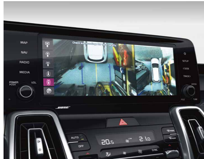
CÁMARA DE VISIÓN 360°

Mantente sano y salvo: para garantizar que mantienes la vista en la carretera, el Head Up Display te proporciona toda la información necesaria.