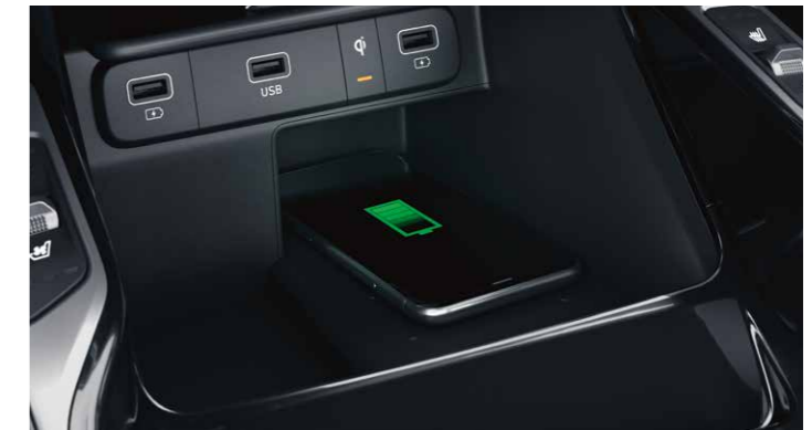
CARGADOR INALÁMBRICO (TELÉFONO MÓVIL)

Los dos respaldos de la primera fila tienen puertos de carga USB integrados para el uso de los pasajeros de la primera y segunda fila. Además, el área de carga cuenta con puertos de carga USB a cada lado para los pasajeros de la tercera fila. Igualmente, la consola central trasera tiene un puerto de carga USB y también una toma de 12V.