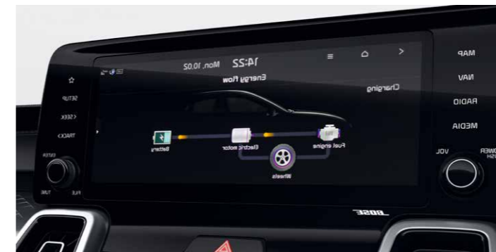
NAVEGADOR UVO CONNECT CON PANTALLA DE 26 CM (10,25")

Un elegante panel de instrumentos digital personalizable ofrece información sobre la temperatura, presión de los neumáticos y otros datos esenciales sobre el vehículo y el viaje. También muestra el estado del sistema de carga híbrido, incluidos los niveles y uso del combustible y de la batería. Su pantalla de alta resolución facilita la lectura de una gran cantidad de información en un solo vistazo.