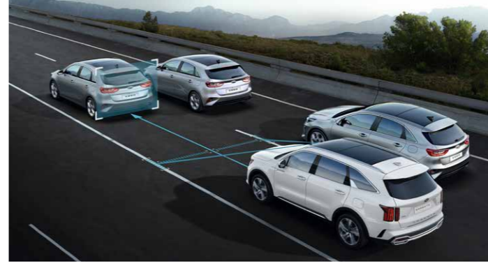
ASISTENCIA PARA SEGUIMIENTO DE CARRIL CON TRÁFICO INTENSO (LFA)

A través de este sistema se controlan los patrones de conducción y te avisa si pierdes la concentración. Por ejemplo, si estás en un atasco y el coche que tienes delante se aleja y no te mueves, te alertará; o si muestras signos de somnolencia, la DAW te animará a tomar un descanso.