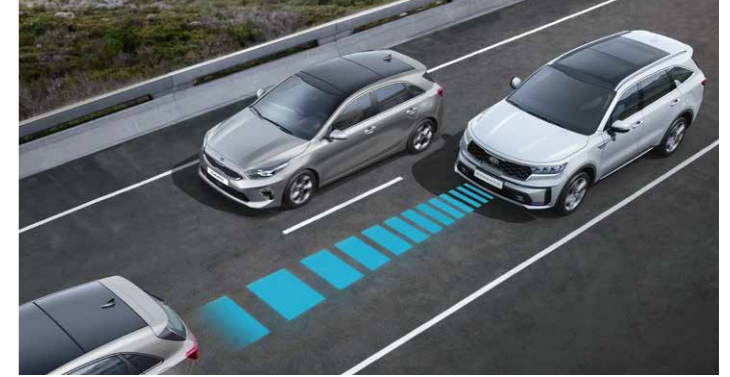
CONTROL DE CRUCERO ADAPTATIVO (CON FUNCIÓN STOP&GO)

Una cámara en la parte delantera del coche controla las marcas del carril y, si el conductor se sale del carril, este sistema te alertará e incluso modificar la trayectoria.