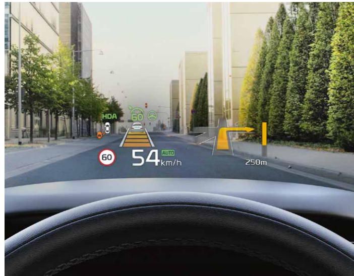
HEAD-UP DISPLAY (HUD)

Disfruta de la tecnología y de la experiencia de conducción en el nuevo Kia Sorento.