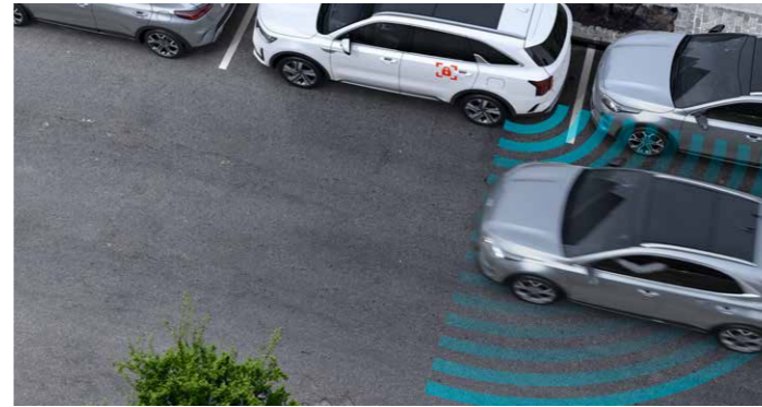
SISTEMA DE ASISTENCIA DE PREVENCIÓN DE COLISIÓN EN SALIDA DE APARCAMIENTO (SEA)

Diseñado para mejorar la visibilidad de los puntos ciegos, el BVM utiliza cámaras laterales para que cuando presiones el intermitente, se muestre en el panel de instrumentos la vista de la carretera. Si indicas que irás a la izquierda te mostrará la vista trasera por tu lado izquierdo, y si indicas que irás a la derecha, te mostrará la vista del lado derecho.