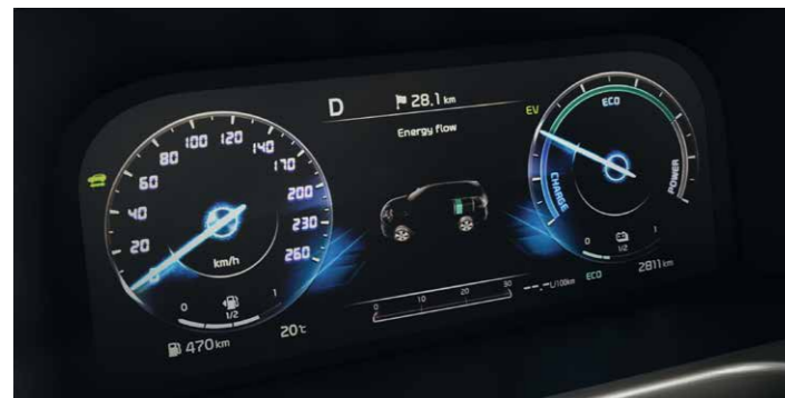
PANEL DE INSTRUMENTOS DIGITAL SUPERVISION DE 31 CM (12,3")

El sistema aprovecha la energía generada durante la deceleración del vehículo, pudiendo almanecarla en la batería para un uso futuro.