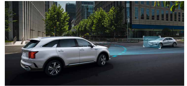
SISTEMA DE ASISTENTE DE PREVENCIÓN DE COLISIÓN FRONTAL EN INTERSECCIONES (FCA)

A través de unos sensores diseñados para detectar niños o mascotas en la segunda o tercera fila, activará alertas visuales y auditivas si detecta movimiento en el interior, antes y después que el vehículo se cierre con llave.