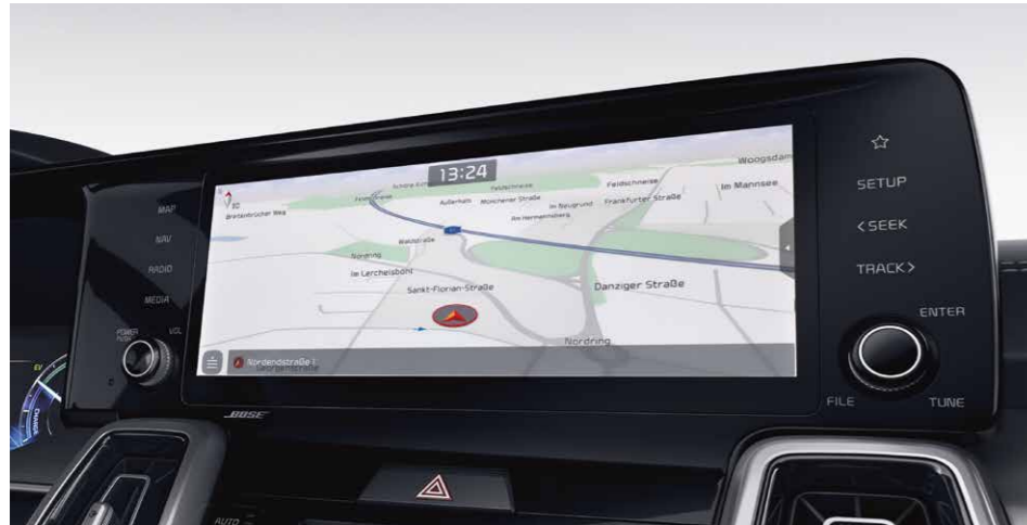
NAVEGADOR CON PANTALLA DE 26 CM (10.25")

Desde el momento en el que te sientes dentro del nuevo Kia Sorento, descubrirás la última tecnología, diseñada para que disfrutes de la conducción.