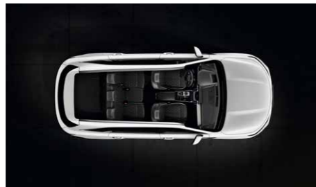
Tercera fila completamente plegada