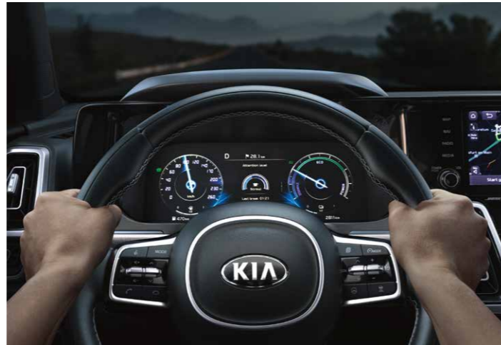
SISTEMA DE DETECCIÓN DE FATIGA DEL CONDUCTOR (DAW)

Cuando las condiciones lo permitan, el Kia Sorento encenderá las luces largas automáticamente. Cuando la cámara del parabrisas detecta las luces de un vehículo que se acerca de noche, el asistente de luces de carretera cambia automáticamente a luz de cruce para evitar deslumbrar a los demás conductores.