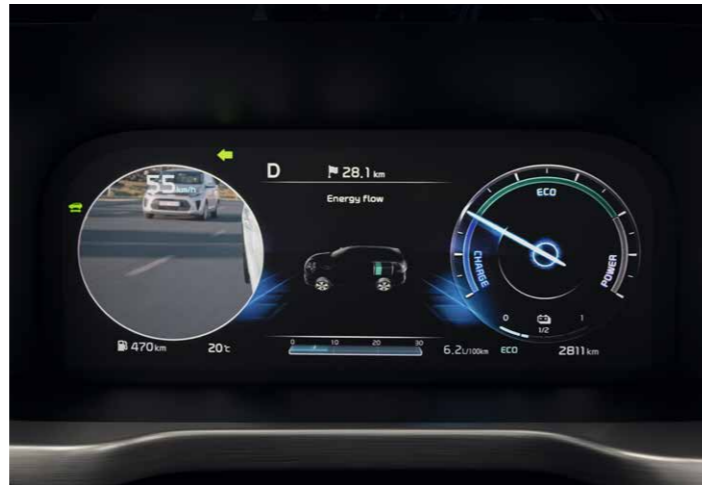
MONITOR DEL ÁNGULO MUERTO EN EL PANEL DE INSTRUMENTOS (BVM)

Cuando quieras cambiar de carril, este sistema detecta cualquier vehículo en tu ángulo muerto y te alertará con un símbolo de advertencia en el espejo lateral y en la pantalla del interior del coche. Si empiezas a cambiar de carril mientras un coche está en tu punto muerto habiendo activado el intermitente y siempre que se cumplan unas determinadas premisas, el Kia Sorento puede activar automáticamente los frenos para evitar una colisión.