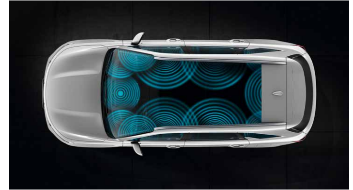
SISTEMA DE AUDIO PREMIUM BOSE®

Este programa único garantiza que su sistema de navegación estará siempre actualizado.