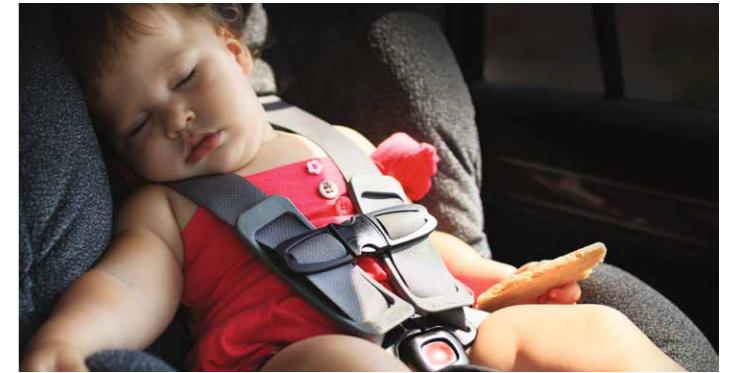
ADVERTENCIA PLAZAS TRASERAS (ROA)

Si tu airbag se dispara en respuesta a una colisión, la información se envía inmediatamente al ESC para frenar tu vehículo. El MCBA frenará para prevenir una colisión posterior o mitigar su impacto.