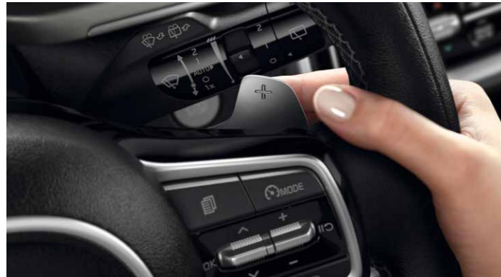
LEVAS DE CAMBIO EN EL VOLANTE

Sigue tu propio camino con las diferentes opciones mecánicas. La nueva motorización gasolina 1.6 T-GDi híbrida con tracción 4x2 u opcional 4x4. También hay un motor de combustión diésel 2.2 CRDi con ambas tracciones disponibles.