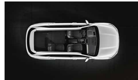
Tercera fila completamente plegada y segunda parcialmente plegada