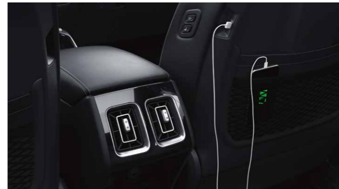
PUERTOS USB EN TODAS LAS FILAS

Experimenta un audio premium gracias a 12 altavoces, un amplificador externo y tecnología de vanguardia. Transforma cualquier fuente de audio en una asombrosa experiencia de sonido envolvente.