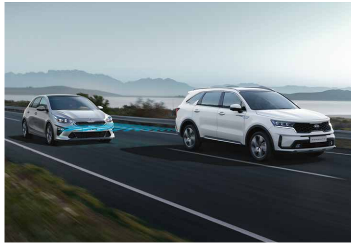
SISTEMA DE DETECCIÓN DE ÁNGULO MUERTO (BCA)

Nadie sabe lo que el camino o el viaje que tenemos por delante puede depararnos y, por eso, el nuevo Kia Sorento está provisto de la tecnología más sofisticada para un viaje más seguro.