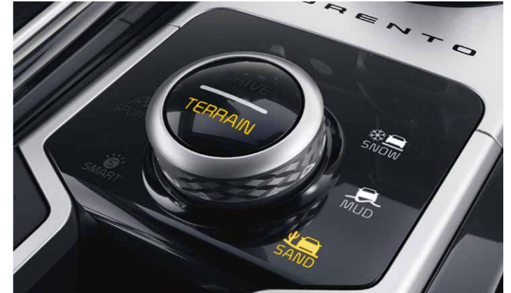
TERRAIN MODE (TMS)

El Sorento 1.6 T-GDi híbrido (HEV) incorpora una transmisión automática de seis velocidades, asegurando una transición suave entre los cambios de marcha.