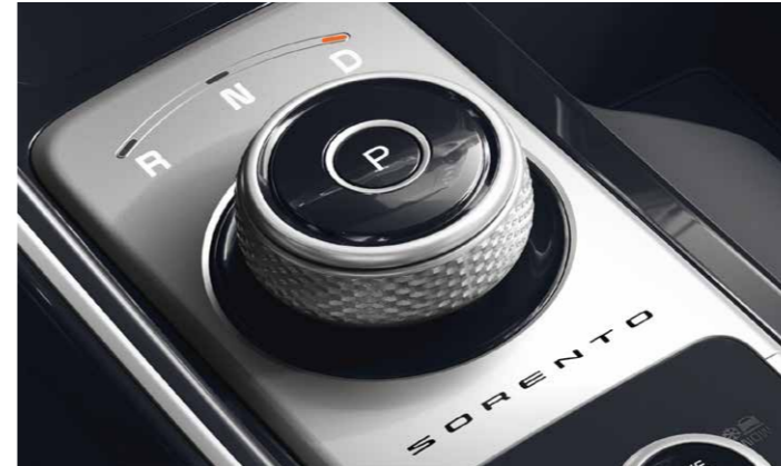
DIAL GIRATORIO DE CAMBIO

La nueva transmisión automática ofrece una selección de modos de conducción que se adaptan en función de las necesidades del conductor, mejorando el ahorro de combustible o la aceleración. El modelo de combustión diésel de Sorento ofrece cuatro modos de conducción (Eco, Confort, Sport y Smart), mientras que el Sorento Híbrido (HEV) ofrece los modos Eco, Sport y Smart.