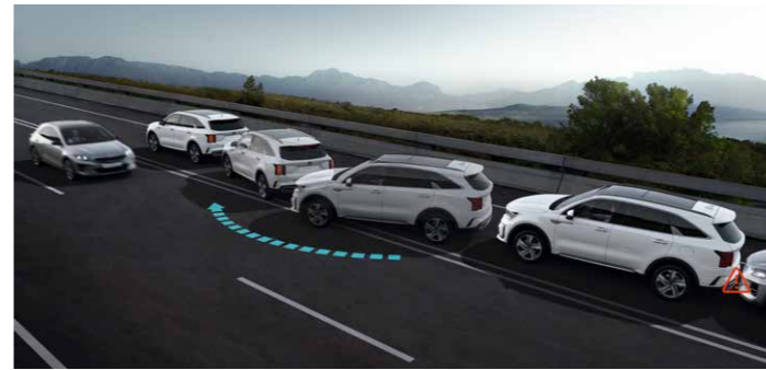
ASISTENTE DE FRENADA TRAS COLISIÓN (MCBA)

Diseñado para ayudar a evitar que los pasajeros de la parte trasera salgan del vehículo cuando el sistema detecte posibles peligros que se aproximen. Si eso ocurre, el sistema activará el cierre centralizado y se activará una alerta visual y acústica.