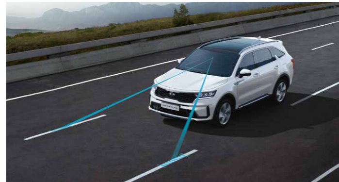
SISTEMA DE ASISTENCIA DE MANTENIMIENTO DE CARRIL (LKA)

El sistema de conducción autónoma de nivel 2 de Kia supone un gran paso hacia la conducción semi-autónoma. Junto con el control de crucero adaptativo, el LFA controla la aceleración, la frenada y la dirección en función de los vehículos que van delante; esto hace que conducir en atascos sea más fácil y seguro. El sistema utiliza una cámara y sensores para mantener una distancia segura con el vehículo que nos precede. Además, detecta las líneas de la carretera para mantener a tu coche en el centro del carril.