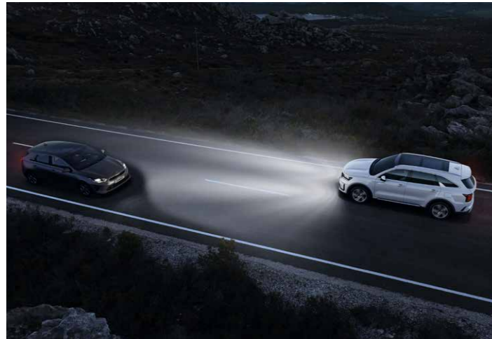
ASISTENTE DINÁMICO PARA LUCES DE CARRETERA (HBA)

Ya sea corto o largo, es bueno saber que en cada viaje el Kia Sorento te ayudará a mantener seguros tanto a ti como a tus acompañantes.